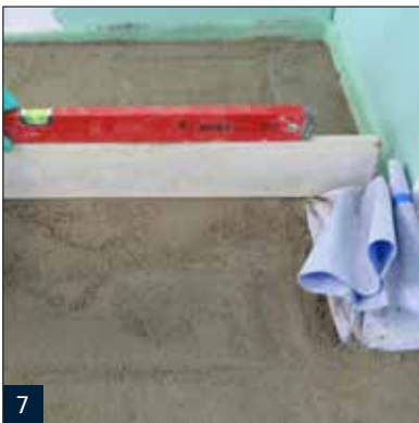
7 Erstellen eine Gefällestrichs mit ausreichenden Gefälle.