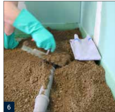
6 Unterfüttern des Rinnenkörpers mittels M 54 FM.