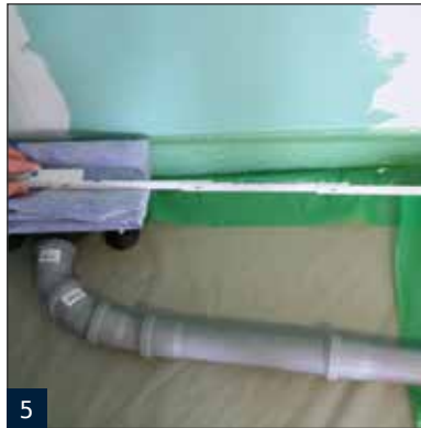
5 WATER LD V ausrichten.