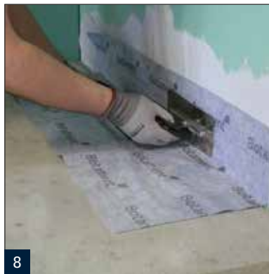
8 Einarbeiten der werksseitig angebrachten Dichtmanschette mit Multiproof.