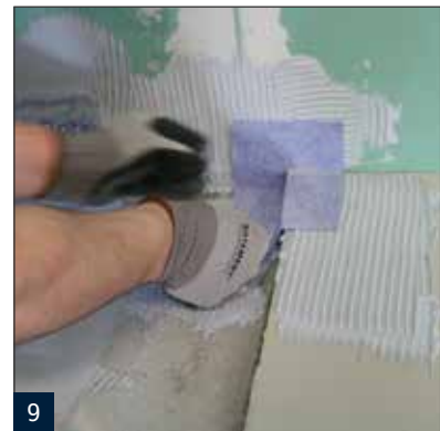
9 Einarbeiten der SB78 Stufenmanschette im Eckbereich der Dusche.