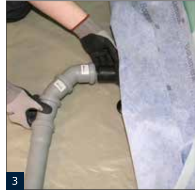
3 Anschluss der Water LD V an der Abwasserleitung.