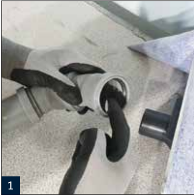
1 Montage des Ablauftopfes am Rinnenkörper. Bitte alle Verbindung mit entsprechenden Gleitmittel versehen