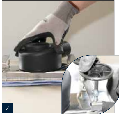
2 Montage der optionalen variable einstellbaren Montagefüße. Bitte alle Verbindung mit entsprechenden Gleitmittel versehen.